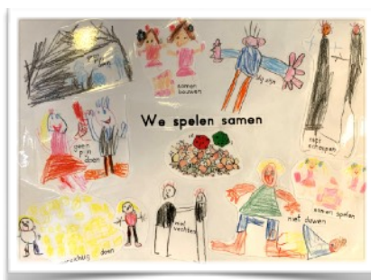
groepswork afspraken groep 3

De eerste week heeft in het teken gestaan van het opnieuw wennen, praten over de vakantie en het werken aan sfeer en groepsvorming. De kinderen zijn in gesprek geweest over de afspraken in de klas die ze zelf prettig zouden vinden. De eerste weken staan in het kader van deze klasse-afspraken.